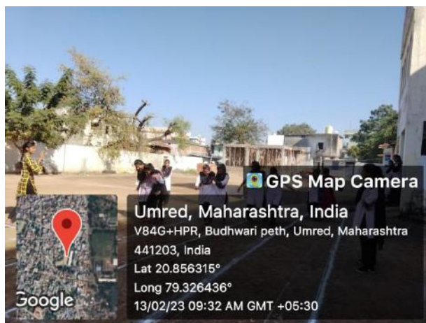
Word Memory Competition