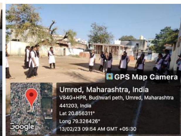
Shot Put Competition